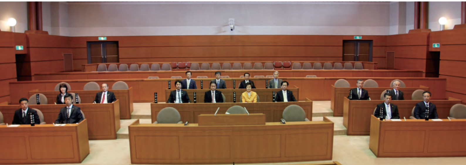
議員定数2人削減後の新たな顔ぶれの議員16人によりスタートします。