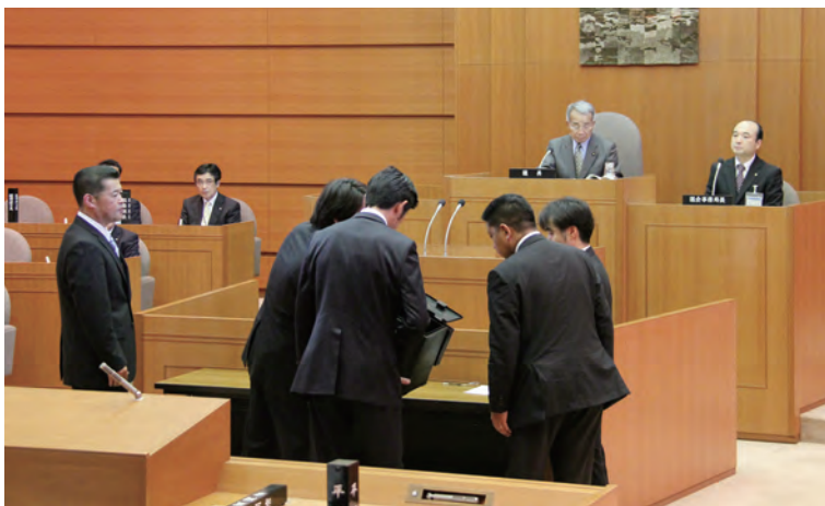
議長選挙開票の様